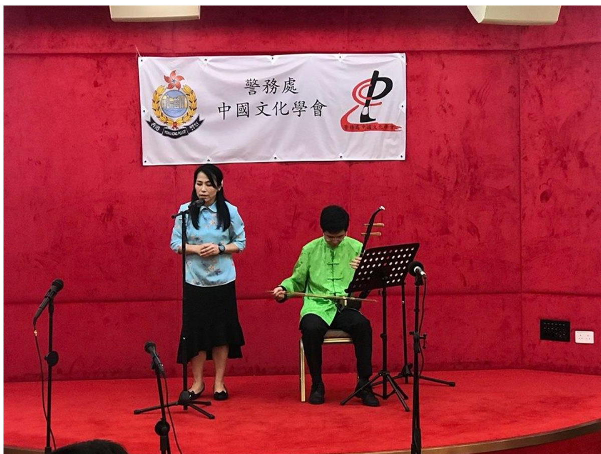
普通話學社成員精湛表演